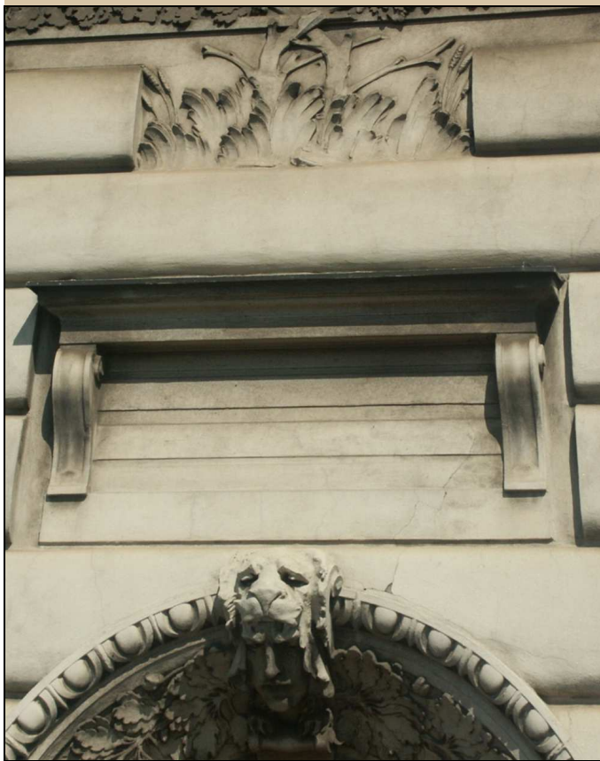
nadpražní římsa – celkový pohled